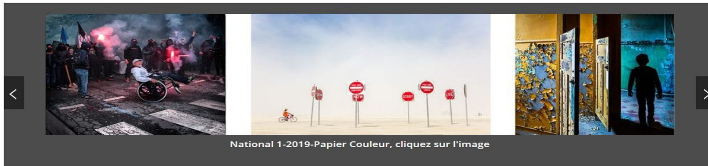
National 1-2019-Papier Couleur, cliquez sur l'image

Accueil Qui sommes nous ? La F.P.F. en images - Forum L'actualité F.P.F. Nos Partenaires Guides/Archives Adhésion